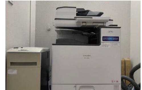
カラーコピー・シュレッダー